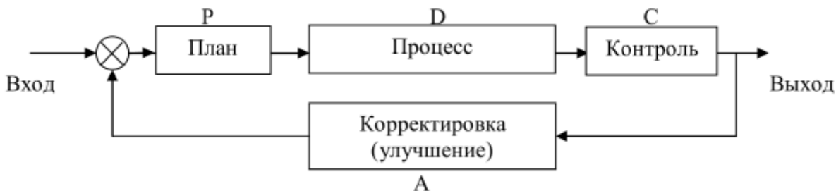
Рис. 1. Цикл Деминга-PDCA

непрерывного улучшения процессов рекомендуют использовать цикл PDCA или цикл Деминга при реализации процессного подхода, который направлен на повышение эффективности работы организации. На рисунке 1 представлена схема осуществления данного цикла действий: планировать, осуществлять, контролировать, совершенствовать.